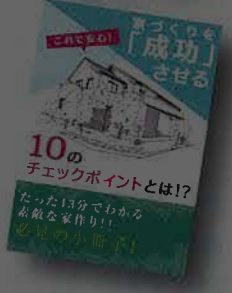
「家づくりを「成功」させる 10のチェックポイント」